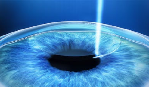
2. Laser erzeugt Zugang