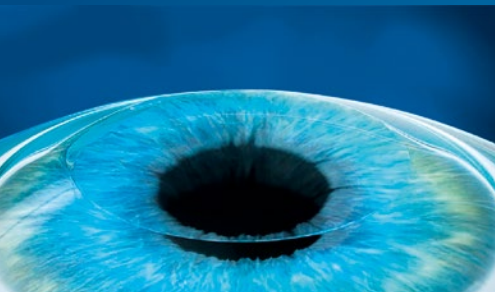
3. Flap wird zurückgeklappt