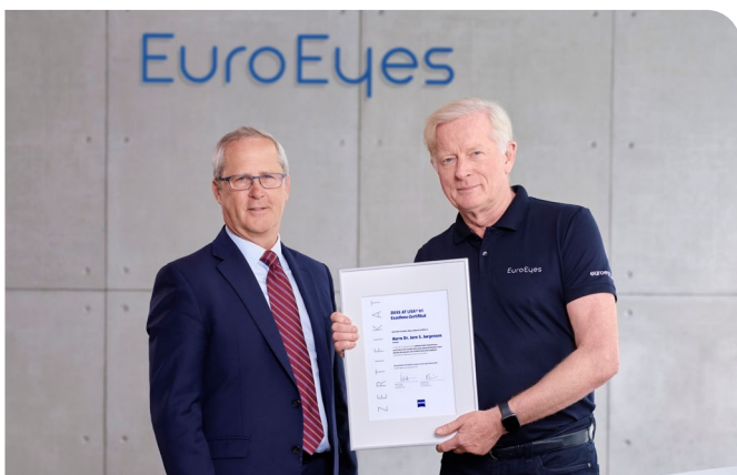
ÜBERREICHUNG DES PREISES FÜR DIE MEISTEN ZEISS TRIFOKAL-LINSEN-IMPLANTATIONEN