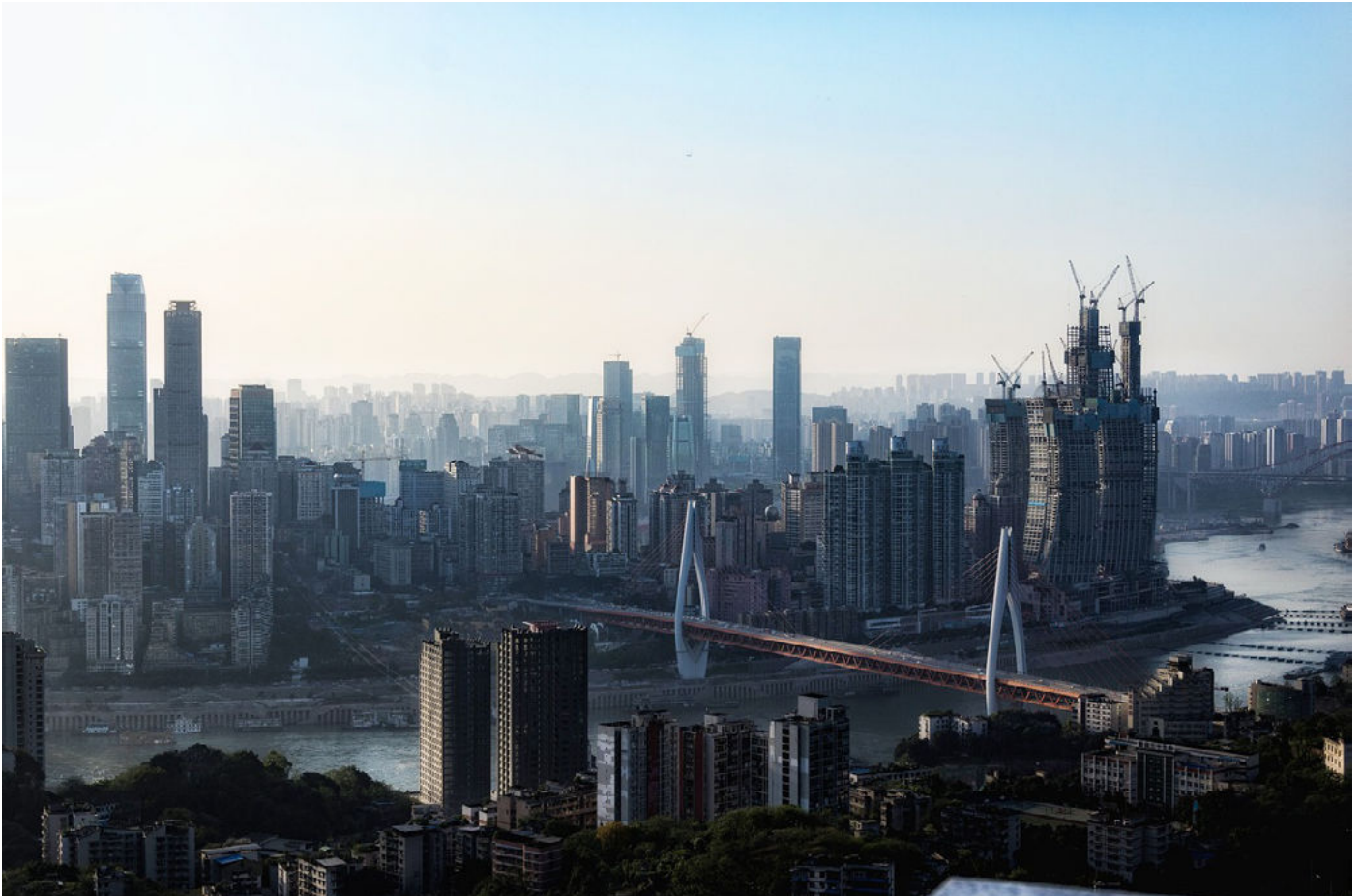
Chongqing in China

Die EuroEyes Gruppe eröffnet im Mai 2020 eine weitere Klinik in China. Die Entscheidung fiel dabei auf Chongqing, eine der größten Städte der Welt und das Handelszentrum im Südwesten von China. Im neuen Royal Riverside Center baut EuroEyes auf 550m 2 Fläche im Erdgeschoss die siebte Augenklinik in China. EuroEyes bietet dort als Center of Excellence das komplette Spektrum der refraktiven Chirurgie auf höchstem Niveau an.