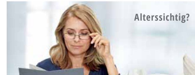
ALTERSSICHTIGE BENÖTIGEN EINE LESEBRILLE

Die Alterssichtigkeit beginnt meist schleichend. Zwischen dem 40. und 50. Lebensjahr treten die ersten Schwierigkeiten beim Lesen auf. Buchstaben erscheinen unscharf und sind nicht mehr klar zu erkennen. Der Griff zur Lesebrille wird erforderlich. Diejenigen, die bereits kurz- oder weitsichtig sind, leiden im Alter zusätzlich unter der Alterssichtigkeit.