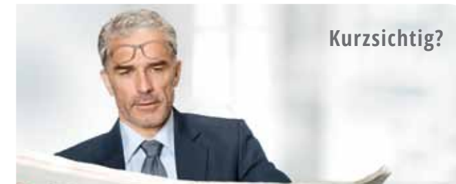
KURZ- UND ALTERSSICHTIGE MÜSSEN IHRE BRILLE BEIM LESEN ABSETZEN