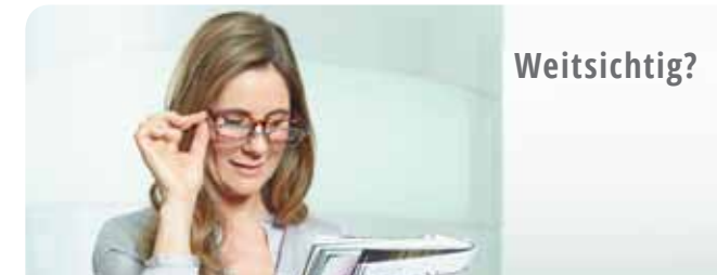
WEIT- UND ALTERSSICHTIGE BENÖTIGEN BEIM LESEN MEHRERE BRILLEN ODER EINE GLEITSICHTBRILLE